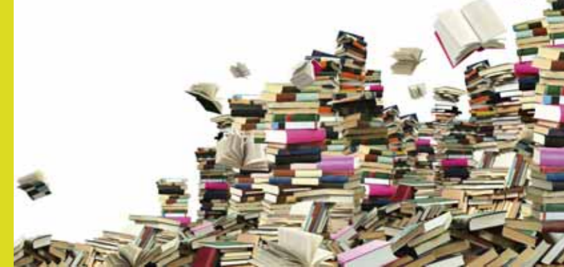
3D-Kunstaktion Buchhandlung