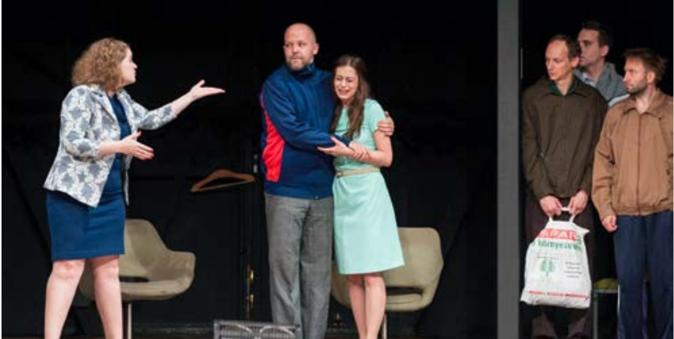
HOPPART, Ungarn, Coriolanus