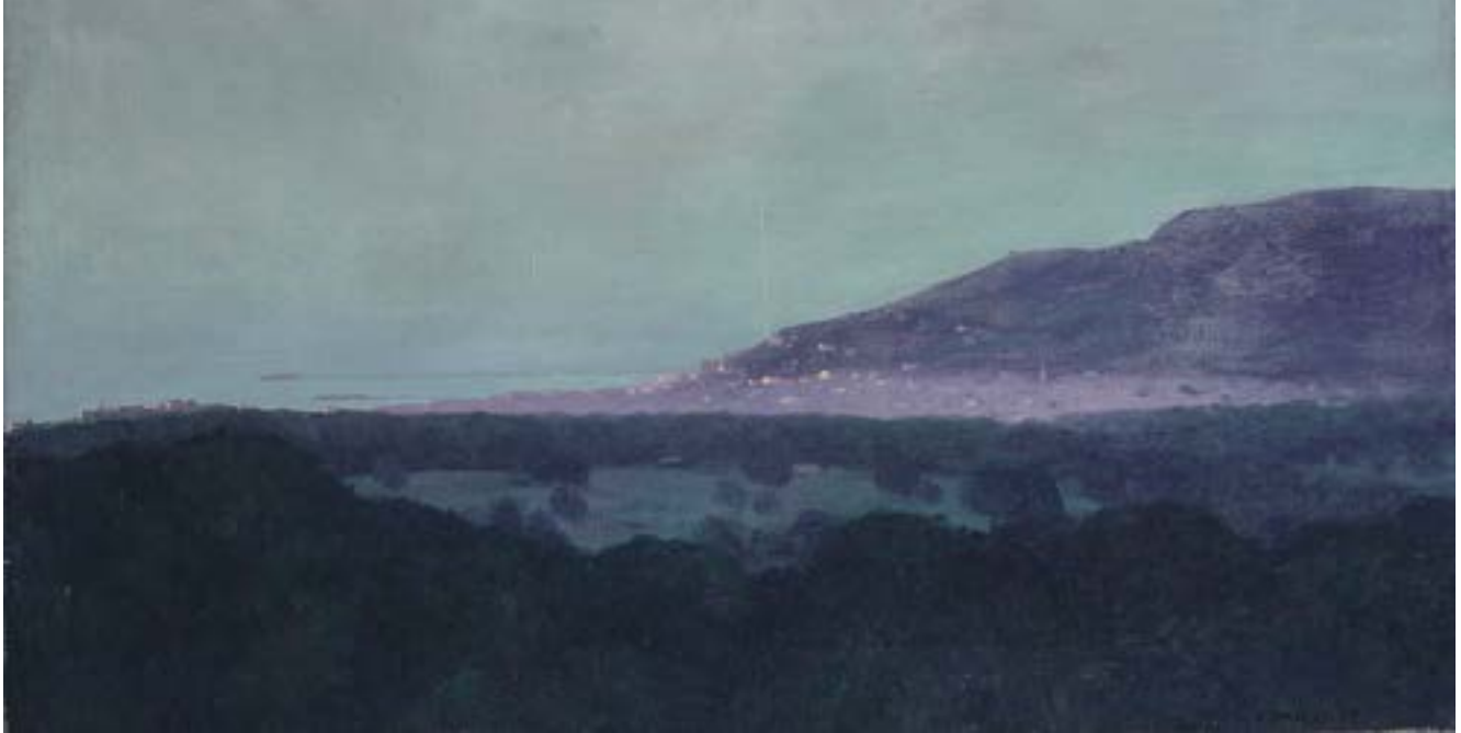
Félix Vallotton, Blick auf Trouville, am Abend , 1910, Öl auf Leinwand, 42 × 80 cm