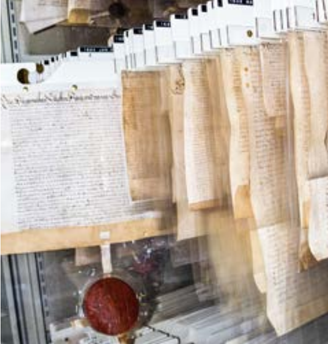
Nach den Urkunden und anderen Beständen im Neusser Stadtarchiv kann nun auch online recherchiert werden.