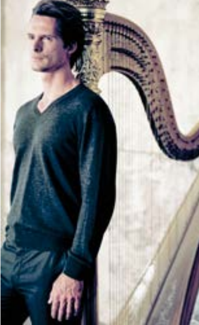
Xavier de Maistre