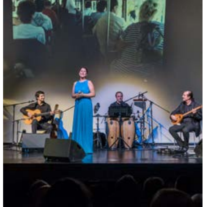
Konzert der Estrada Fado Group am 22. November 2014 im RLT