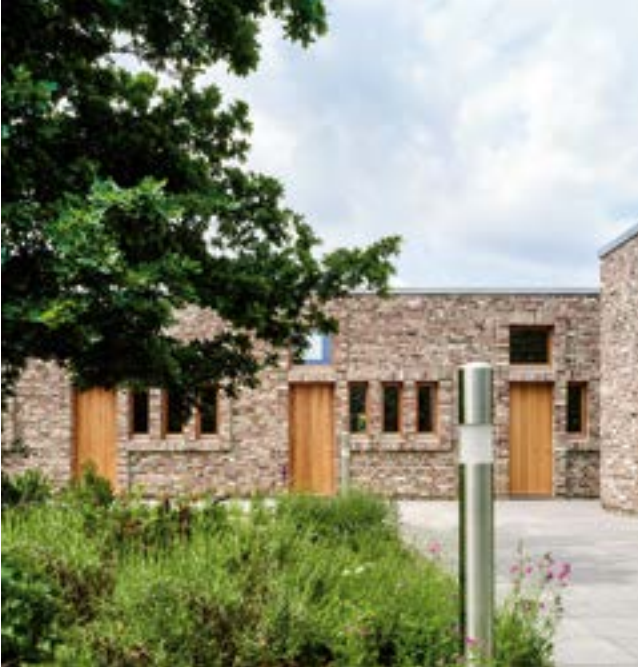
Museum Insel Hombroich, Kloster