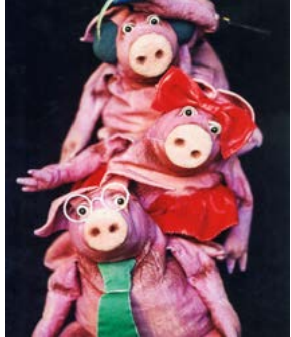
Wundertüte – Seifenblasen Figurentheater, Die drei kleinen Schweinchen