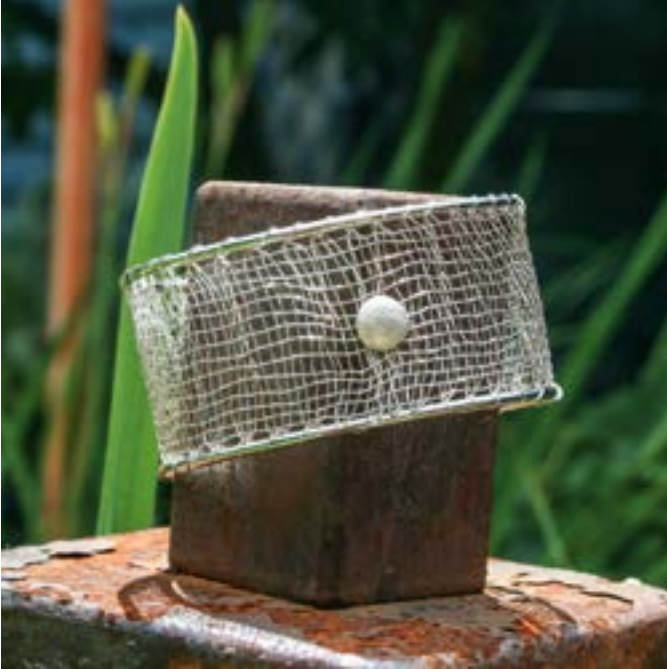
Birgit Göldner: Schmuckklöppeln