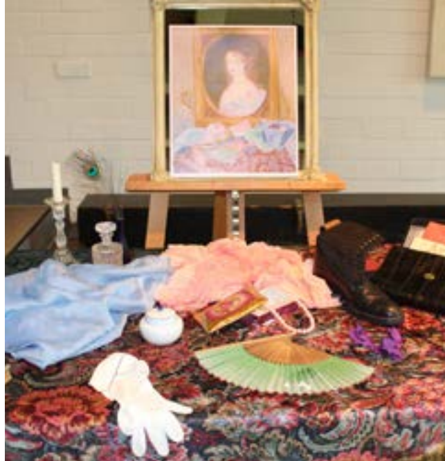
Museumskoffer – Die geheime Sprache der Dinge zu Ensors Gemälde Die Marquise

sechs Holzschnitten Urbachs zu machen. Diese wurde Anfang 2015 ebenfalls im Obertor präsentiert.