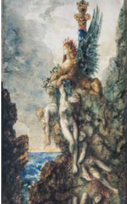
Gustave Moreau, Die Sphinx , um 1886 Aquarell auf Papier, 34,2 × 20 cm