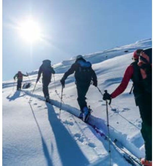
„Grönland – eisige Abenteuer am Polarkreis“ – Axel Vorberg erzählte die Geschichte einer Skidurchquerung im Rasmussen-Gletschergebiet.