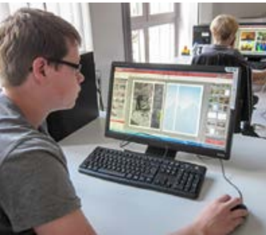
Der Kurs Streetphotographie war Teil des talentCAMPus.

und Andy Warhol inspirieren und die HipHop-Angebote vermittelten Selbstsicherheit im Körperausdruck und im sozialen Miteinander.