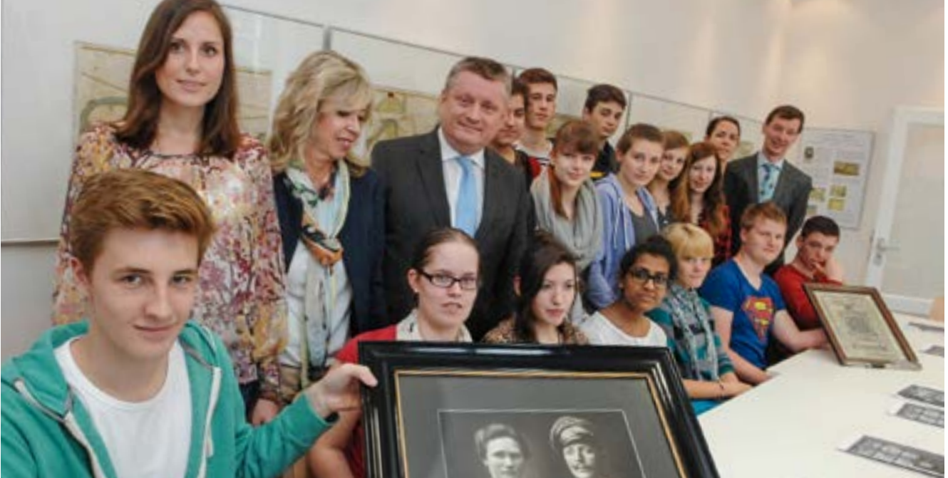
Bundesminister Hermann Gröhe zu Besuch im Stadtarchiv mit Schülern des Projektkurses „Neuss im Ersten Weltkrieg“