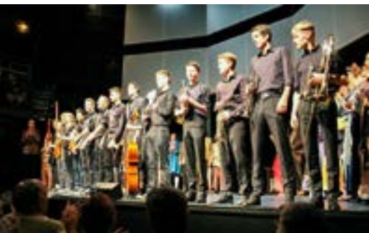
Das Orchester der Oliver -Inszenierung

in der Pop-Musik mit der Band „Fun“ und dem Sinfonieorchester im orchestralen Sound erklangen.