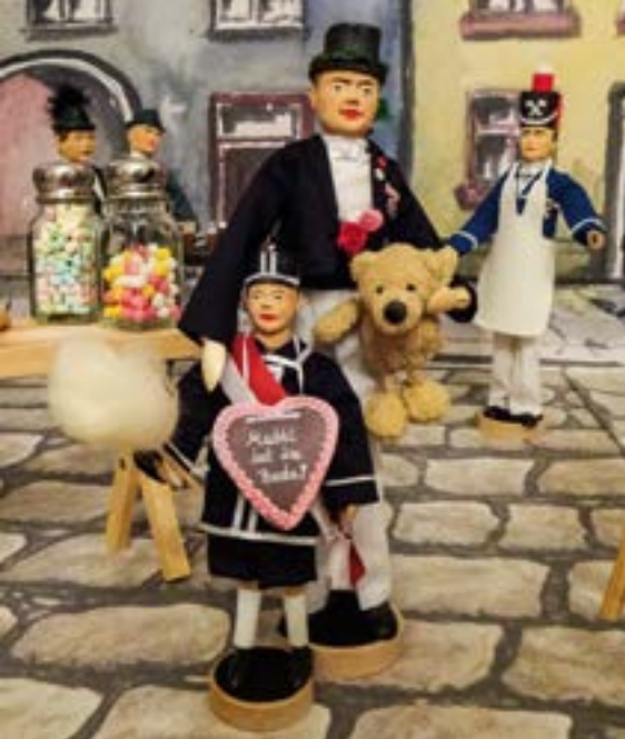
In der Adventszeit wurde die neue Schützenkrippe präsentiert.