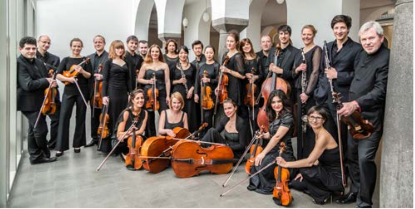
Die Deutsche Kammerakademie im Neusser Zeughaus