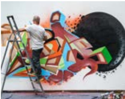
Graffiti-Jam hast du name...