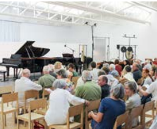
Blick in den Konzertsaal beim Inselfestival

1987 eröffnete der Düsseldorfer Sammler Karl-Heinrich Müller das Museum Insel Hombroich. Das Zusammenspiel aus Kunstsammlung, begehbaren Skulpturen und einer zurückhaltend gestalteten Landschaft ist einzigartig und international wegweisend. Die Raketenstation Hombroich ist ein Ort für Ausstellungen, Tagungen oder auch Konzerte und bietet zugleich Wohn- und Arbeitsraum für Literaten, Musiker und bildende Künstler.