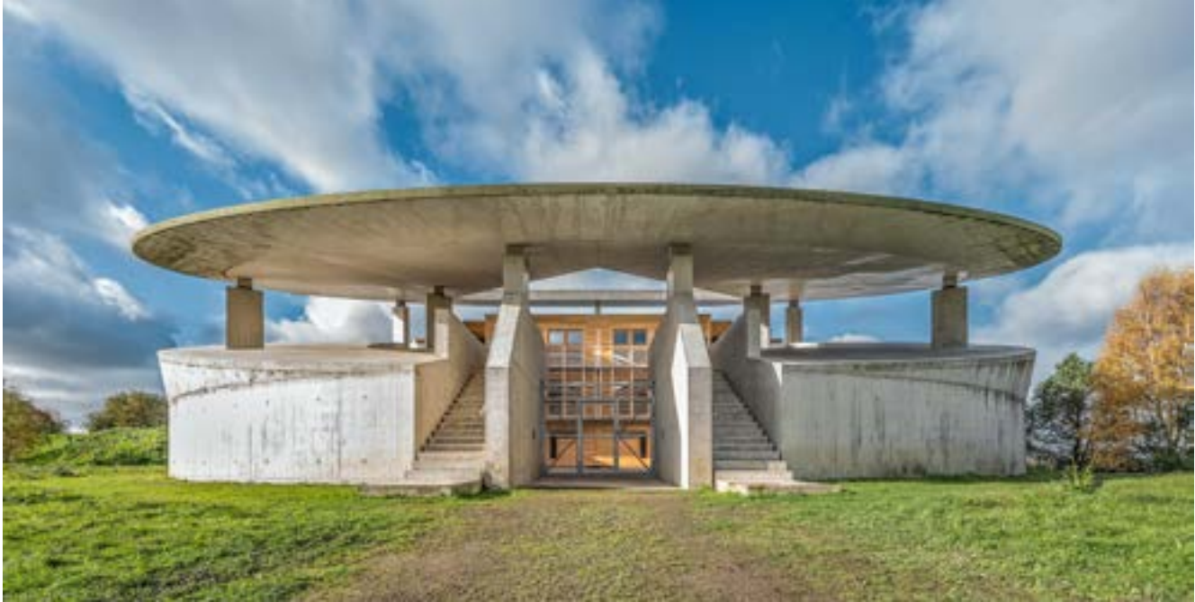
Museum Insel Hombroich, Abraham-Gebäude