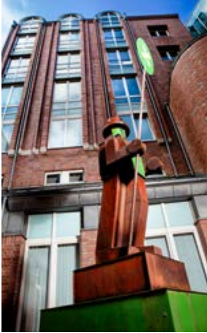
Anatol, Der Stadtwächter , Rathausinnenhof