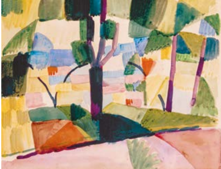
August Macke, Kandern IV , 1914, Aquarell über Bleistift auf Karton, 22,4 × 27,7 cm