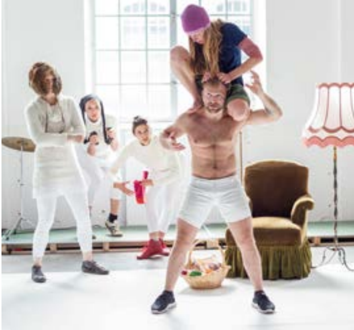
Kultur für Kinder – Theaterkollektiv per.Vers, Rrr. Käppchen