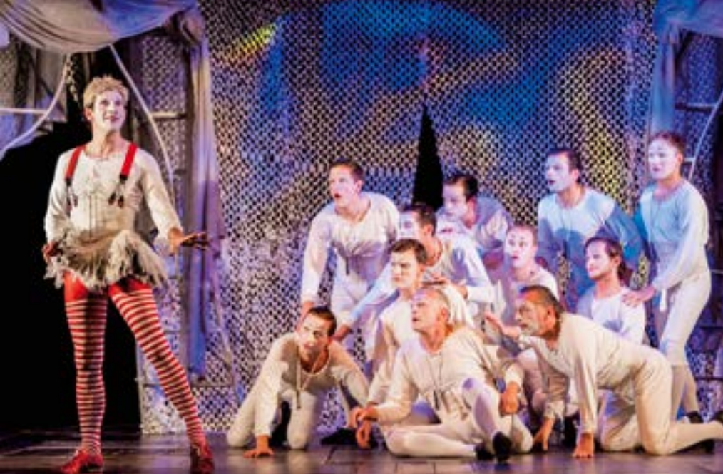
Propeller Company, A Midsummer Night's Dream