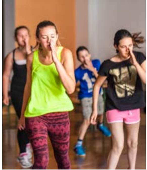
Theaterproben während der Sommerakademie