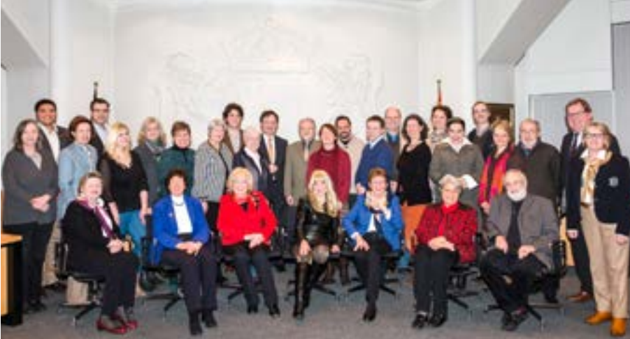
Mitglieder und stellvertretende Mitglieder des Kulturausschusses am 4. März 2015

Der Kulturausschuss ist als Fachausschuss der Stadtvertretung das Gremium in Neuss, in dem kulturpolitische Entscheidungen getroffen werden. Die Kulturverwaltung informiert im Ausschuss regelmäßig über aktuelle Themen. Im Jahr 2014 kam der Ausschuss zu vier Sitzungen zusammen.