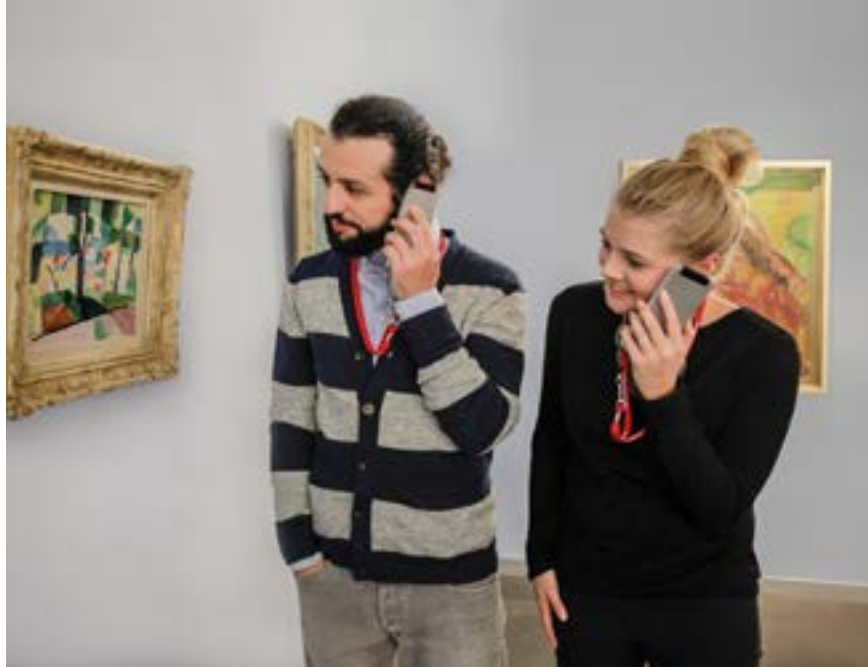
Ein neuer Audioguide führt die Besucher durch das Clemens Sels Museum Neuss.

das Gemälde Weiden im Frühjahr von Christian Rohlf (1849–1938) geliehen.