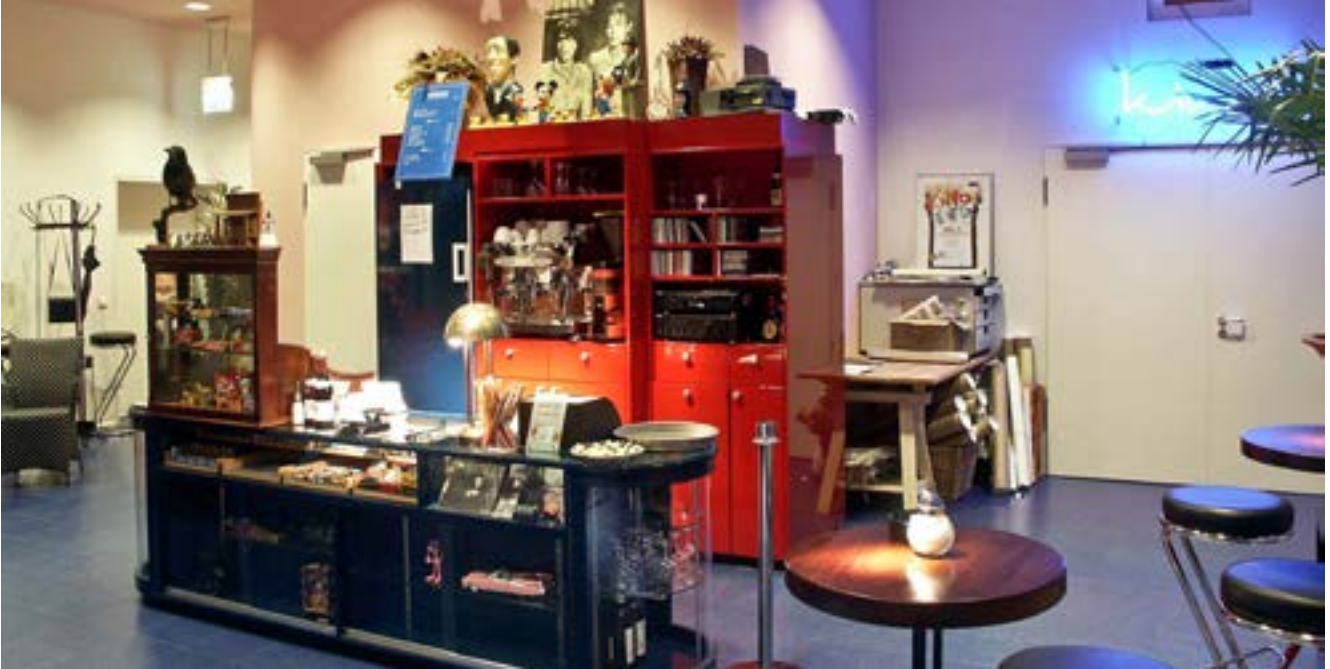
Foyer des Kino HITCH