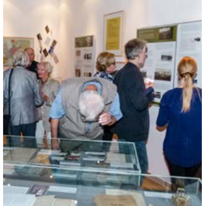
Erste Besucher bei der Eröffnung der Ausstellung