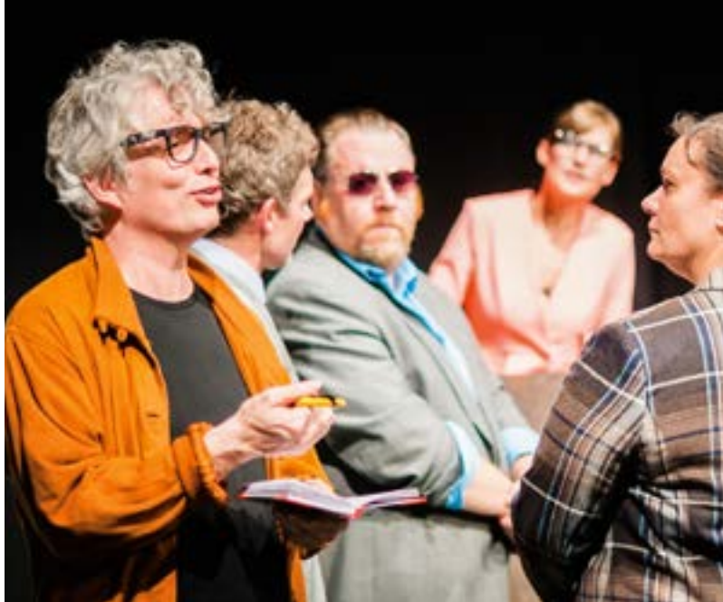
Szene aus Fiese Matenten

angetan und ist seit einem Jahr ein Dauerbrenner. Aber auch die bekannten Stoffe Heidi und Till Eulenspiegel rettet Weibnachten fanden großen Anklang.