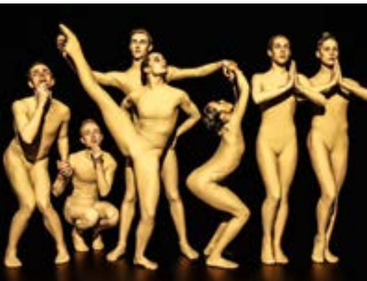
Nederlands Dans Theater 2, Sara

Die Internationalen Tanzwochen Neuss, gegründet 1983, sind ein breitgefächertes Forum des internationalen zeitgenössischen Tanzgeschehens in aktuellen Choreographien und Inszenierungen. Jeweils von Oktober bis März präsentieren sich in der Stadthalle Neuss hochkarätige Ensembles aus aller Welt.