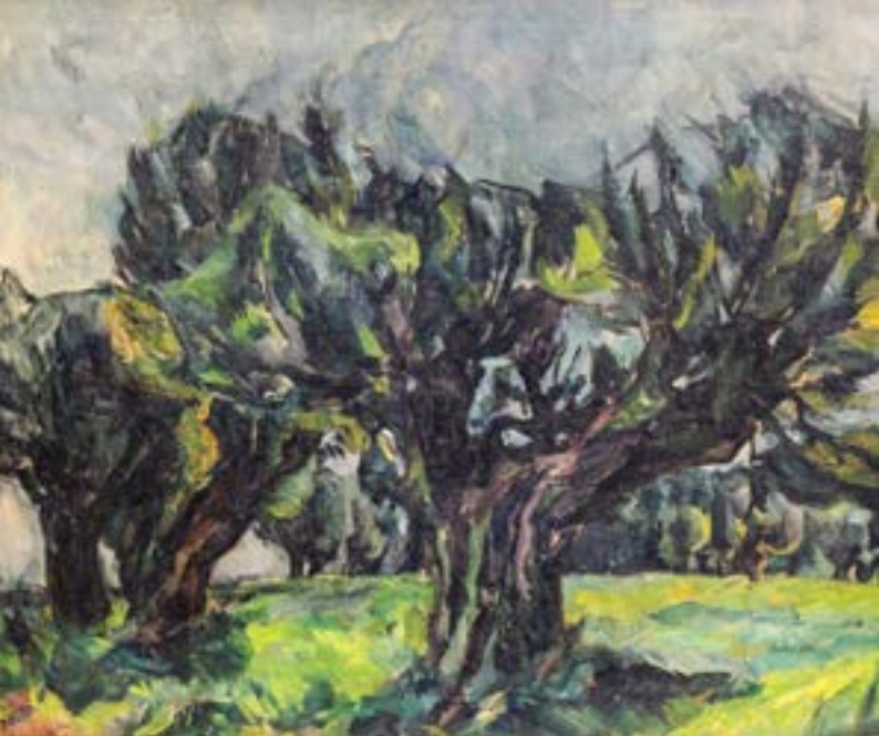
Josef Urbach, Landschaft mit Kopfweiden , um 1916, Öl auf Leinwand, 80×65 cm, Schenkung von Kurt Hollmann, 2014