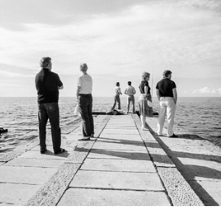
Siegfried Wittenburg: Heiligendamm, 1988 Foto aus der Ausstellung Leben in der Utopie