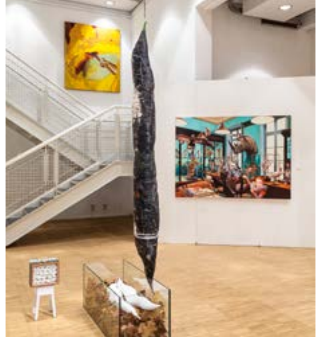
67. Jahresausstellung, Kunst aus Neuss