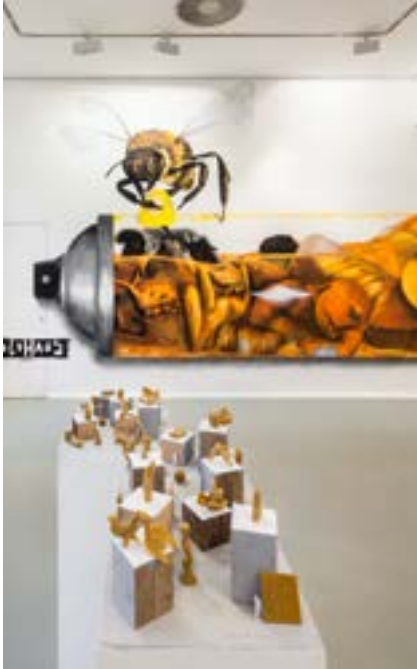
Themenausstellung Bienchen, Bienchen gib mir Honig