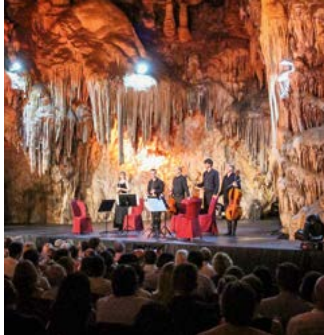
Das Ensemble Quirin beim Auftritt im spanischen Nerja