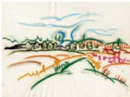
Walter Ophey, Düsseldorfer Rheinbrücke , 1920er-Jahre, Farbkreide auf Papier, 25,4 × 33,6 cm, aus dem Vermächtnis Dr. Günther Rehbein

Das Clemens Sels Museum Neuss (CSMN) beherbergt im Deilmannbau und seinen Dependancen vielfältige Bestände mit herausragenden Werken der Kunst-, Kultur- und Stadtgeschichte. Seine Sammlungsschwerpunkte sind die Kunst des 19. und 20. Jahrhunderts, die archäologischen und volkskundlichen Abteilungen.