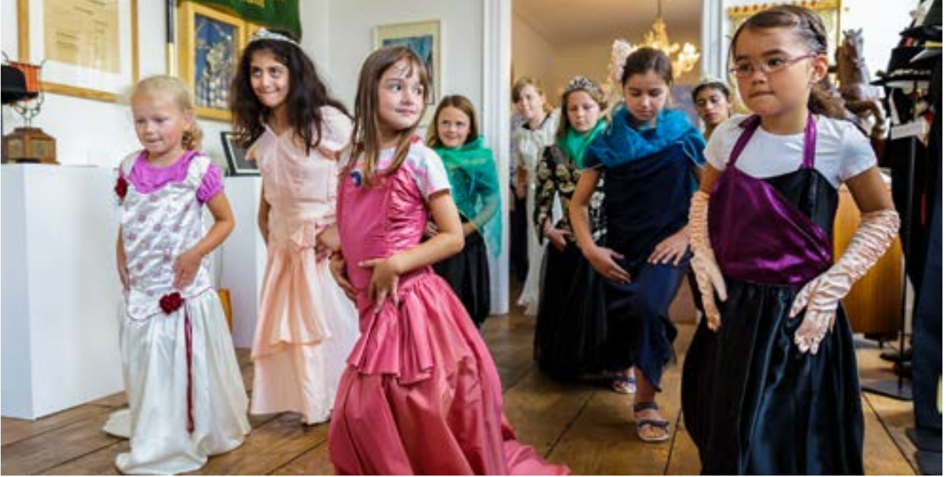
Ferienspaß im Schützenmuseum zum Thema „Königin für einen Tag“.