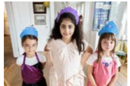
Mädchen während des Ferienspaß-Programms „Königin für einen Tag“ im Rheinischen Schützenmuseum

Das Interkultur-Programm für das erste Quartal 2015 ist gedruckt und gut gefüllt. Für März ist die Uraufführung eines neuen Tanztheater-Projekts mit Viktoria Klunk geplant: Chaos .