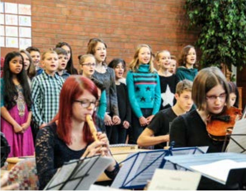
Die Weihnachtsgeschichte von Carl Orff