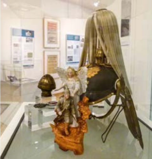
Exponate in der Ausstellung Gottvertrauen und Gehorsam. Neuss im Ersten Weltkrieg