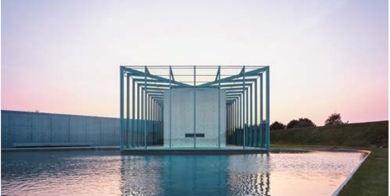
Langen Foundation, Außenansicht