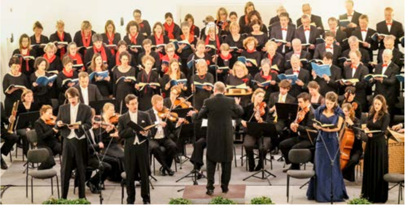
Der Messias von Händel mit Cantica Nova