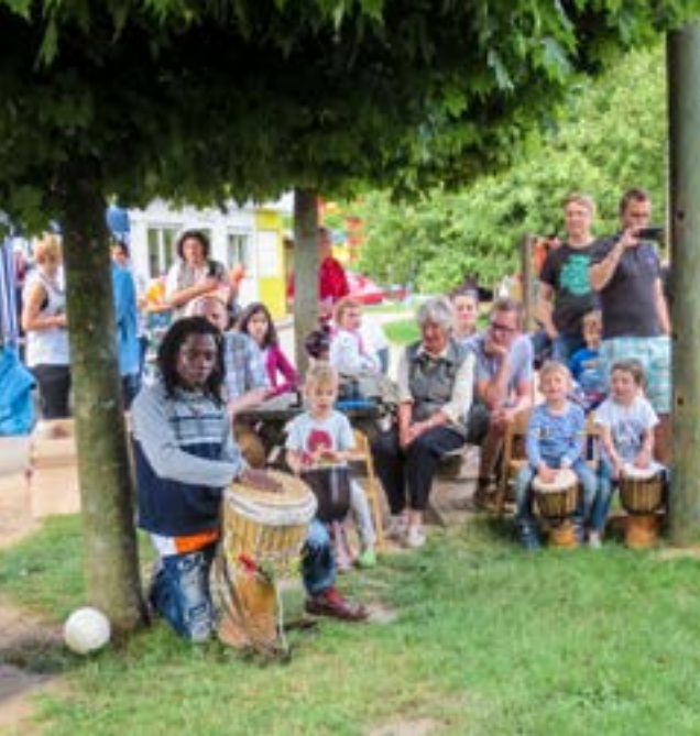
Sommerfest in der Kita „Kleines Abenteuerland“ in Allerheiligen