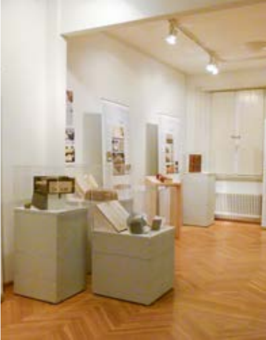
Blick in die Ausstellung Papier ist nicht geduldig