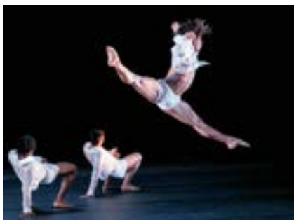
Company Danza Contemporánea de Cuba

Die Tanzwochen starten 2015 mit einem Gastspiel der María Pagés Compañía aus Madrid ins neue Jahr. María Pagés, die ungekrönte Königin des Flamenco wird mit Autorretrato ein sehr persönliches Selbstbildnis ihrer Kunst präsentieren. Die Planung für die 33. Saison der Internationalen Tanzwochen 2015/2016 laufen bereits auf Hochtouren.