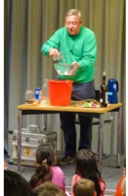
Christoph Biemann von der „Sendung mit der Maus“ beim großen Bibliotheksfest

großen städtischen Einzugsbereichs viele Kinder die in der Innenstadt gelegene Stadtbibliothek nicht selbstständig besuchen können und sie so in der KÖB ihre erste Medien-Anlaufstation haben. Andererseits berücksichtigt es die traditionell enge Zusammenarbeit von Kirchlichen Büchereien mit Kindertagesstätten und Grundschulen. Ein breites Angebot an Bilderbüchern, Vorlesebüchern, Sachbüchern, Büchern für Lesanfänger, Kinderbüchern und Comics sowie mehrsprachigen Büchern bereichert nun das ohnehin vielfältige Angebot der Beteiligten.