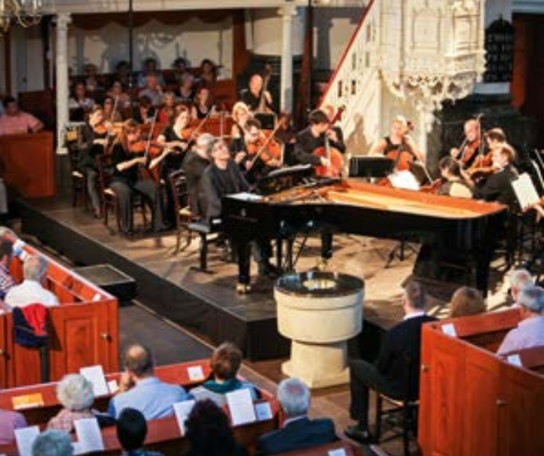
Die dkn beim Gezeitenfestival in Leer