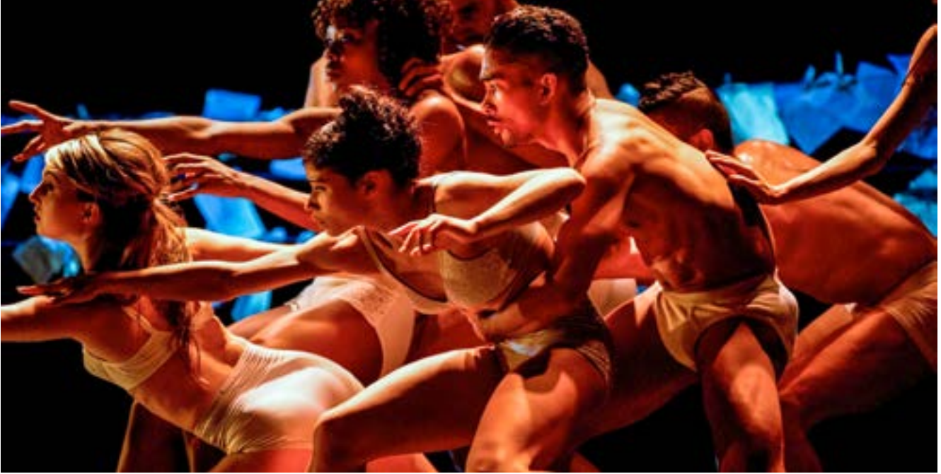
Cedar Lake Contemporary Ballet, Necessity Again