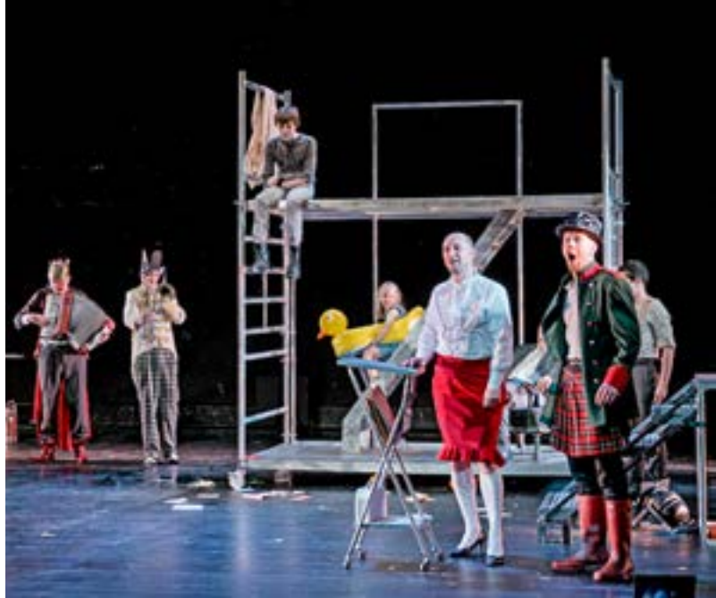
Das Ensemble in Das Spiel ist aus