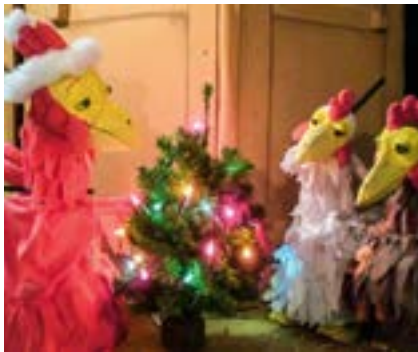
Warten auf's Christkind – Figurentheater Hille Pupille, Morgen kommt der Weihnachtshahn