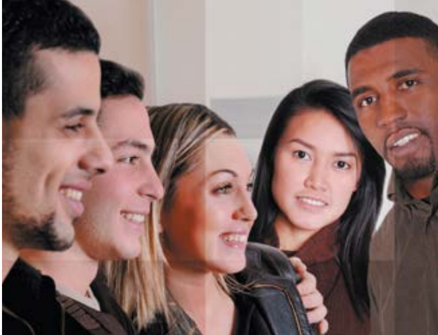
Veranstaltungsflyer zur Seminarreihe für Kandidatinnen und Kandidaten zur Wahl des Integrationsrates