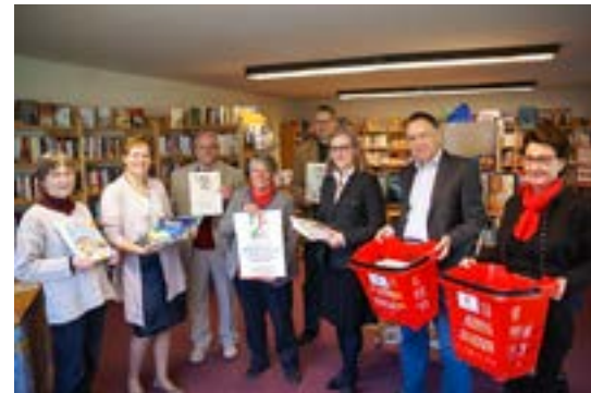
Stadtbibliothek und Arbeitsgemeinschaft Kirchlicher Öffentlicher Bibliotheken kooperieren bei der Leseförderung

2014 hat die Stadtbibliothek bei ihrem Angebot für Erwachsene wieder einen breiten Bogen von populären, sofort ausverkauften Lesungen mit Christine Westermann oder Jan Weiler bis hin zu anspruchsvollen Veranstaltungsreihen gespannt.