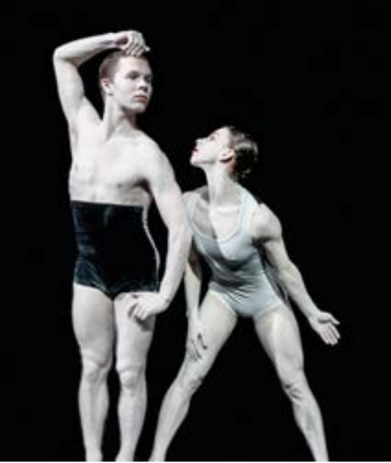
Nederlands Dans Theater 2, Shutters Shut