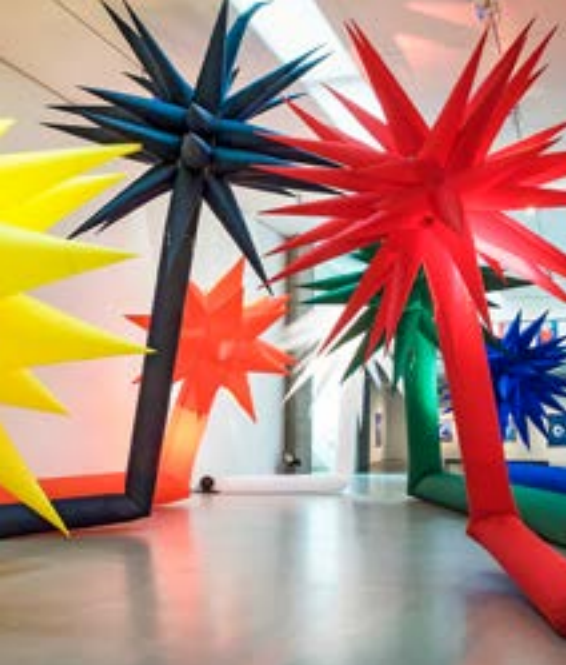
Otto Piene, INFLATABLES, Light and Air © VG Bild-Kunst, Bonn 2014