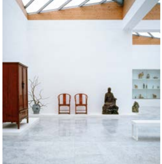
Museum Insel Hombroich, Labyrinth