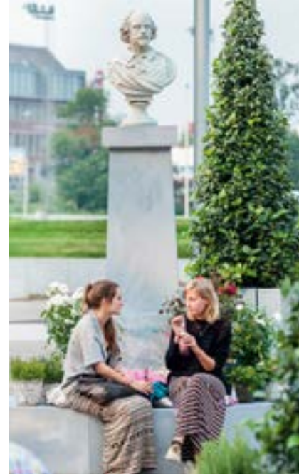
Zuschauer im Außenbereich