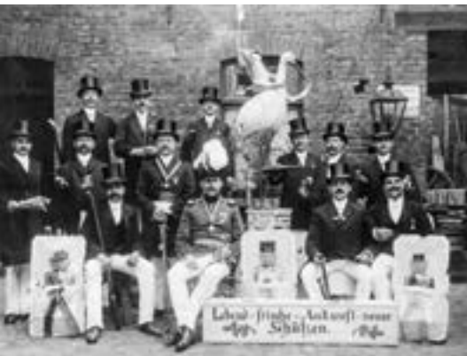
„Fackeln“ in Form von Motivwagen gehören schon seit mehr als 100 Jahren zum Neusser Schützenfest dazu.

2014 feierte das Rheinische Schützenmuseum Neuss sein 10-jähriges Jubiläum und kann inzwischen nicht nur auf die Einrichtung einer Dauerausstellung zur Geschichte des rheinischen Schützenwesens verweisen, sondern ebenso auf die erhebliche Erweiterung der Sammlungen von Museum und Archiv, zahlreiche Sonderausstellungen sowie verschiedene Projekte zur Erforschung des Schützenwesens im Rheinland.