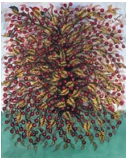
Séraphine Louis, Kirschen und gelbe Blätter , um 1930, Öl auf Leinwand, 92 × 72 cm