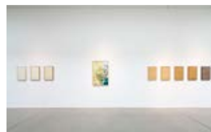
Corin Sworn, Installationsansicht Vibrant Matter

Ab dem 18. April 2015 zeigt die Langer Foundation rund 40 Werke von Olafur Eliasson aus der Sammlung Boros in Berlin. Die Langer Foundation freut sich, daraus – korrespondierend mit der Architektur Tadao Andos – eine Auswahl von Rauminstallationen, Fotografien, Objekten sowie eine Außenskulptur zu zeigen. Die Ausstellung erlaubt den Blick auf Eliassons Arbeit aus der Perspektive der Sammler und bietet zugleich einen repräsentativen Überblick über das Werk des Künstlers seit seinen Anfängen.