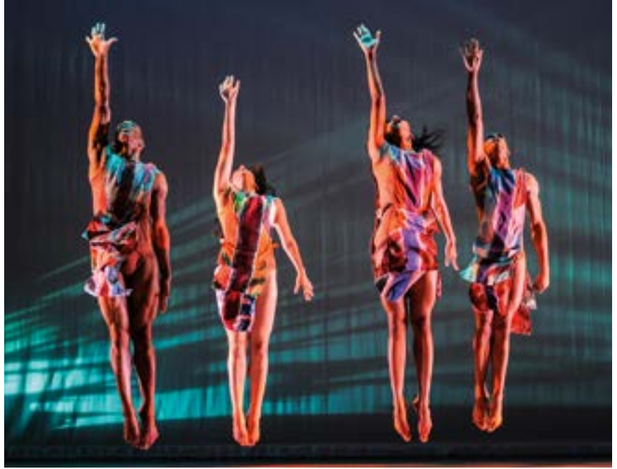
Ailey II in Judith Jamison's Divining