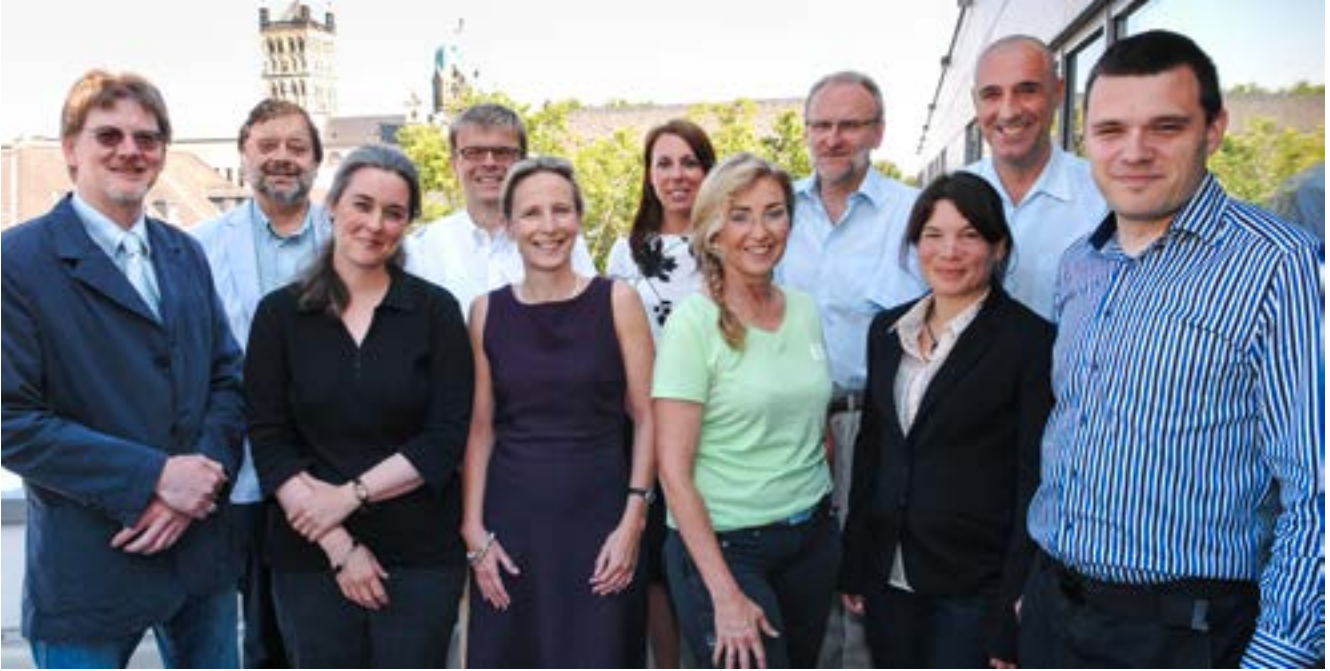
Das Team der Volkshochschule Neuss