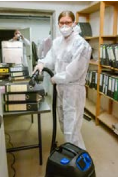
Sicherung von Archivgut: Aktenübernahme aus einer Neusser Schule in Schutzanzügen