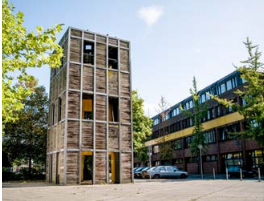
Haus-Rucker-Co, Kommunikationsröhre , Marienkirchplatz