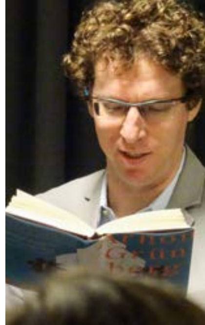
Literarischer Sommer: Lesung von Arnon Grünberg

mierten Historiker Gerhard Hirschfeld und Herfried Münkler – am gesamtstädtischen Programm „Epochenschwelle 1914“. Anlässlich des 25. Jahrestages des Berliner Mauerfalls 1989 beleuchtete die Stadtbibliothek in Kooperation mit dem Kino Hitch, dem Rheinischen Landestheater und der Volkshochschule in zwei literarischen Veranstaltungen rückblickend die damaligen Ereignisse.