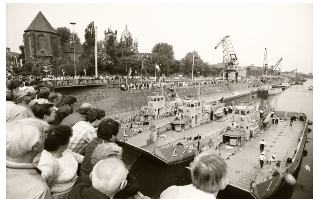
Evenement in havenbekken 1 ter gelegenheid van de 4e Hanzedag van de moderne Hanze in Neuss aan de Rijn in juni 1984