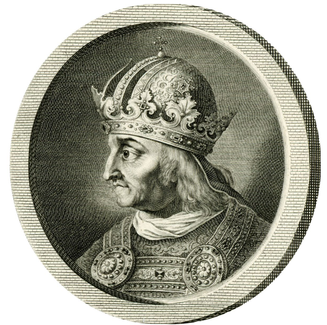
Keizer Frederik III (1415–1493)