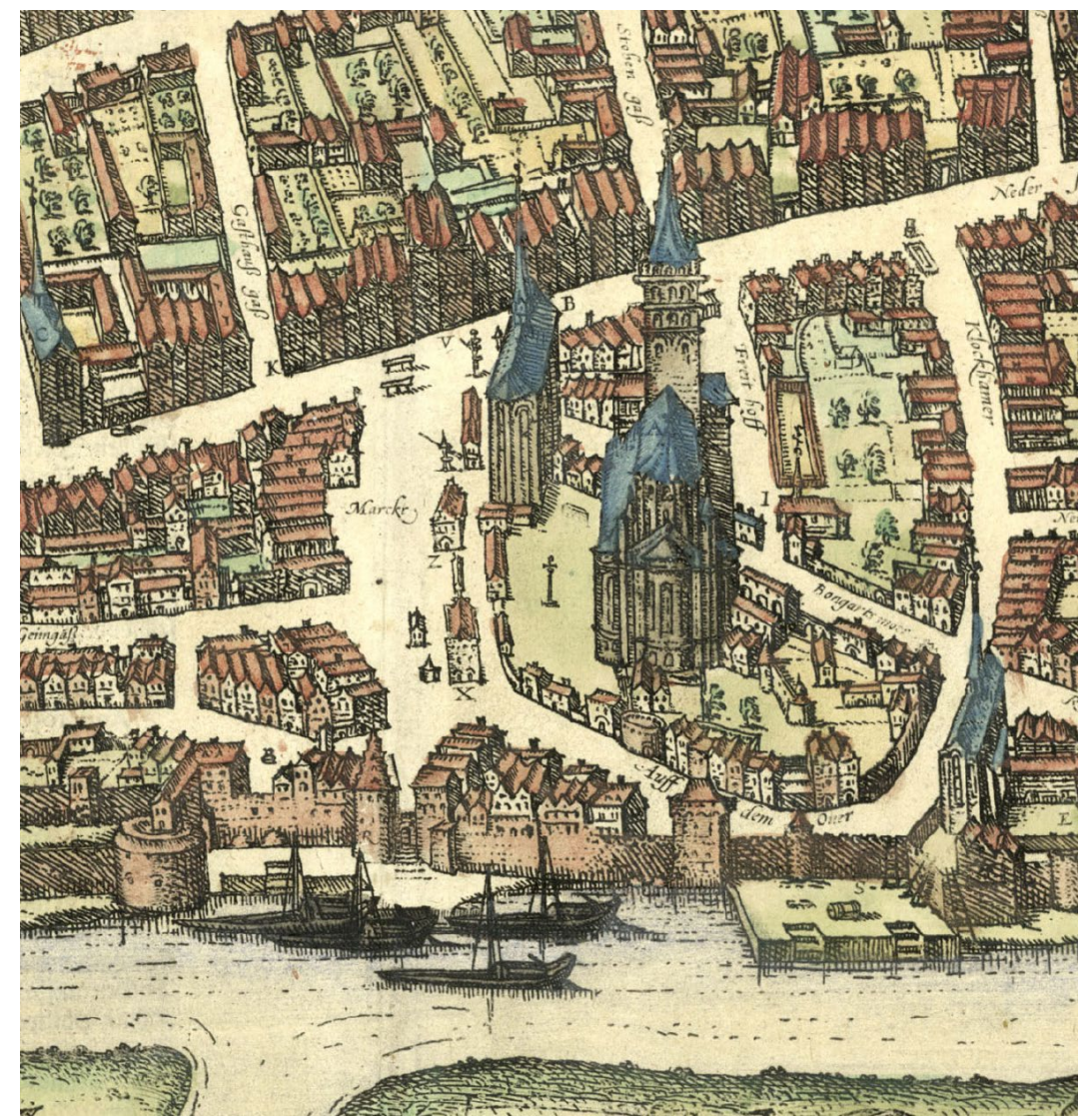
De stad Neuss met de steigers onder de markt, Quirinus-Münster en Glockhammer; gravure in koperplaat ca. 1590