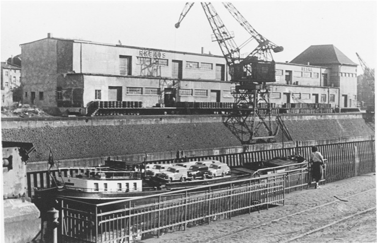
Entrepôts du Hafengebäude 1 avec les travaux d'extension de 1936

Conception graphique : Cornelius Uerlich