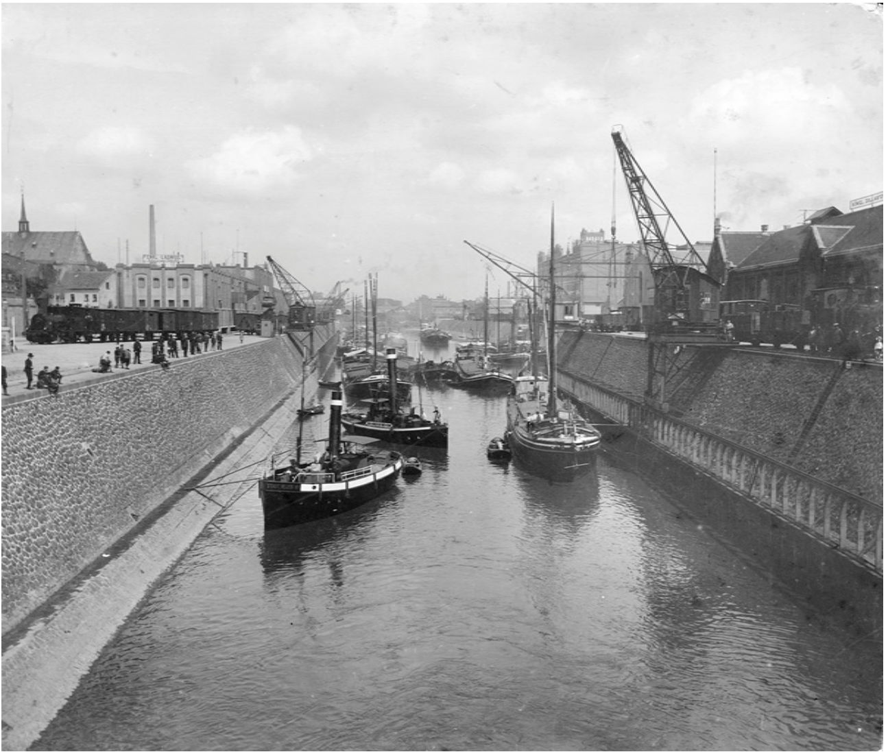
Hafenbecken 1 peu après l'extension, à droite la Königliche Zollabfertigung, vers 1908