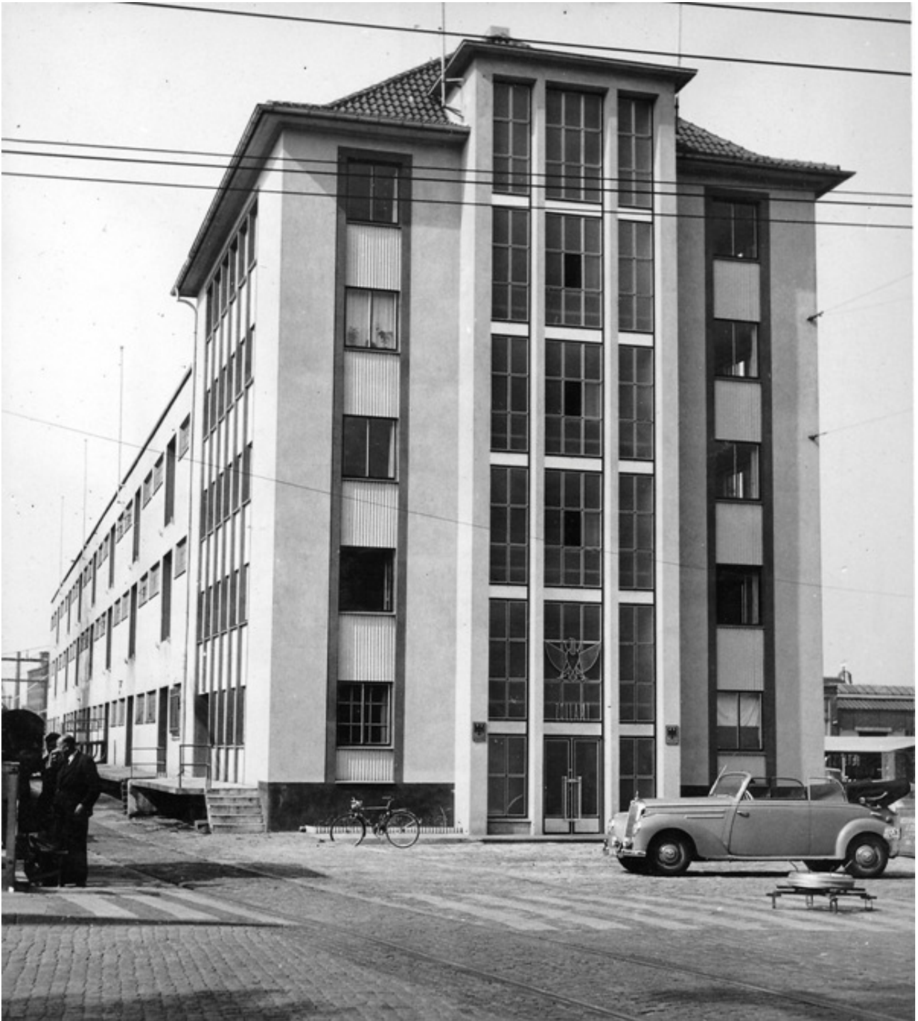
Le bureau de douane construit en 1953 à côté des entrepôts, vers 1955