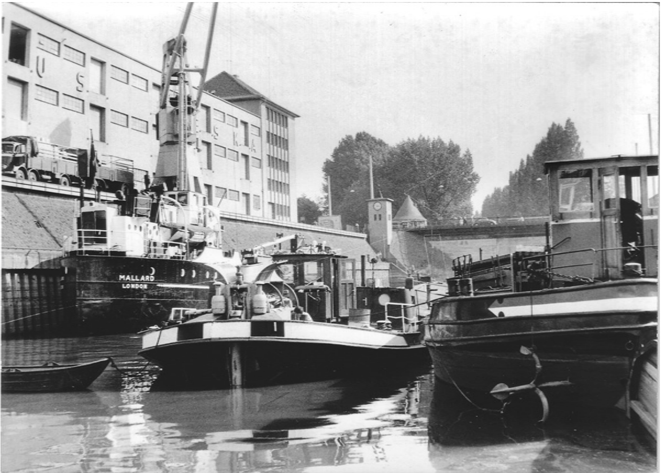
Basses eaux dans le Hafenbecken 1 devant l'entrepôt Neska, à l'arrière-plan l'horloge du barrage et le pont Hessorbrücke, vers 1961