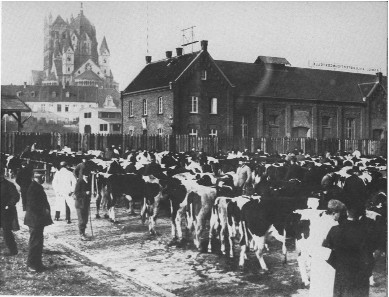
La foire aux bestiaux municipale derrière le bureau de douane au niveau de la Hessentor, vers 1910