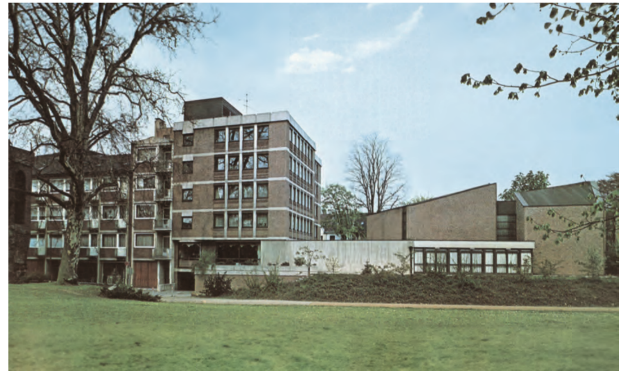
Gesellschaftshaus der „Bürger“ mit Bürohaus und Saal, 1974