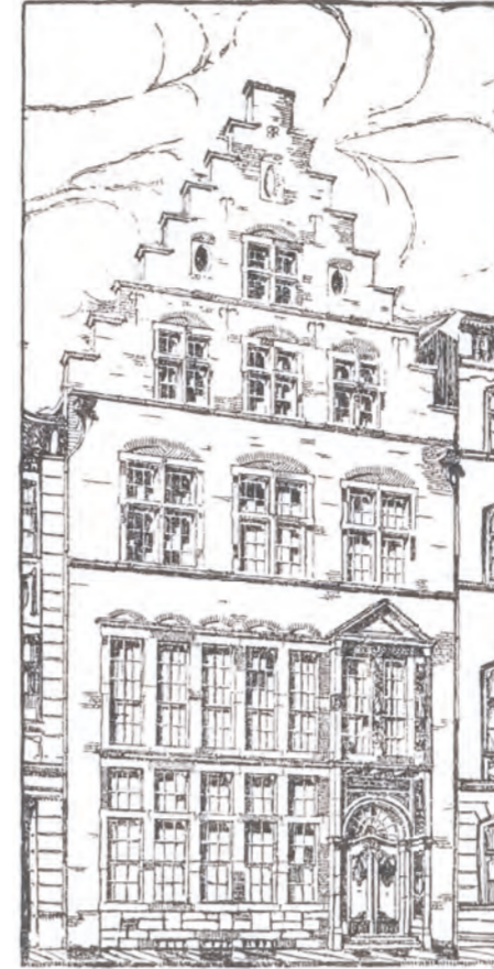
Gesellschaftshaus an der Niederstraße, erbaut 1909