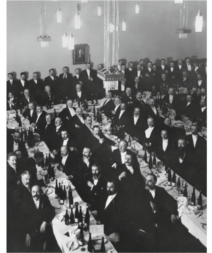
Festmahl anlässlich der Einweihung des neuen Hauses, Januar 1910