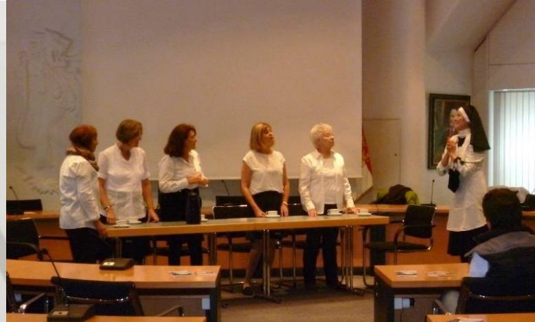
„Die Herbstfalter“ vom TAS