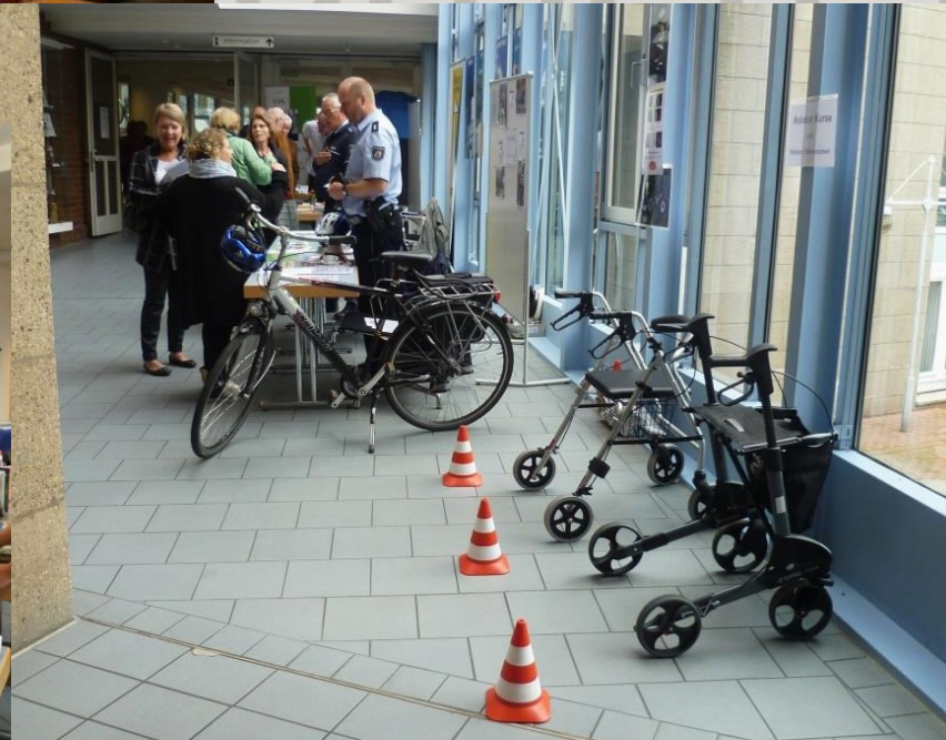
„Verkehrssicherheitsberatung“ durch POK Kreuels